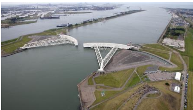
Een van de onderdelen van het Deltaplan is de 'waterdeur' bij de toegang tot de Nieuwe Waterweg. Bij erg hoog zeewater en zware storm gaan de deuren dicht. Knap bedacht!

De Nederlanders vechten al eeuwenlang tegen de gevaren van de zee en de rivieren. Ze zijn daar erg goed in. Maar soms verliezen ze. Zoals in 1953.