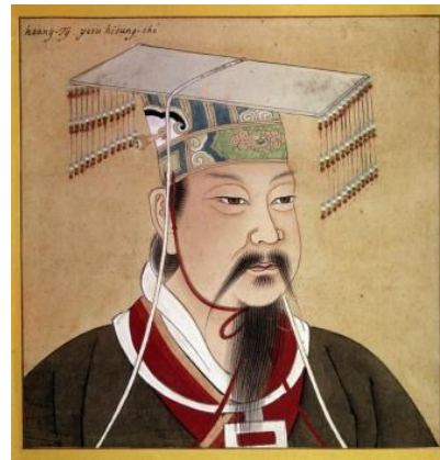
Qin Shi Huangdi (259 v.chr.-210 v.chr.)

Loop door naar 1974. Als je daar de QR-code scant, krijg je een filmpje te zien van een leger met wel 6000 soldaten uit het graf van Qin Shi Huangdi, de eerste Chinese keizer. Qin was net als Mao een dictator die veel mensenlevens op zijn geweten heeft.