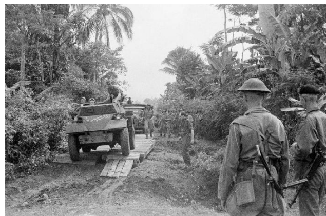
Nederlandse militaire in actie in voormalig Nederlands-Indië

Tip: Als je meer wil weten over de voormalige Nederlandse koloniën, scan dan de QR-code.