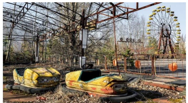
Verlaten kermisterrein bij Tsjernobil. Uit een enorm groot gebied rond de kerncentrale zijn de bewoners hals over kop weggevlucht..

Tip: bekijk het filmpje achter de QR-code.