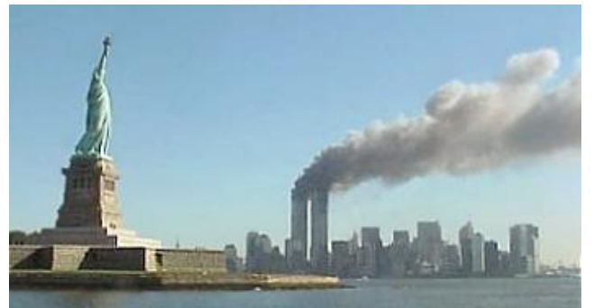
De Twin Towers (= tweelingtorens) van het World Trade Center (= wereld handelscentrum) in New York staan in brand

Zo zag New York er vroeger uit. Maar op 11 september 2001 (de Amerikanen zeggen: 'nine eleven') gebeurt er iets verschrikkelijks. Over de hele wereld kijken mensen vol ongeloof naar de televisiebeelden. Wat is er gebeurd?