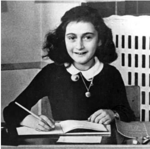
Anne Frank (1929-1945)

Als je nog nooit oorlog hebt meegemaakt, kun je je moeilijk voorstellen hoe blij je bent als er een eind aan komt. Welke gebeurtenis(sen) op kubus 1945 wil je voor de komende tijd onthouden?