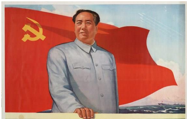
Poster van Mao Zedong (1893-1976)

Precies 25 jaar later (op 11 maart 2011) gebeurt in het Japanse Fukushima eenzelfde soort ramp. Door een zeebeving wordt een kerncentrale daar zo zwaar beschadigd dat er veel levensgevaarlijke straling vrij komt.