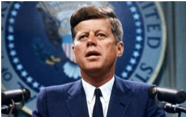
John F. Kennedy (1917-1963)

Ontdek welk verhaal bij deze foto hoort. Wat denk je, is de droom uitgekomen?