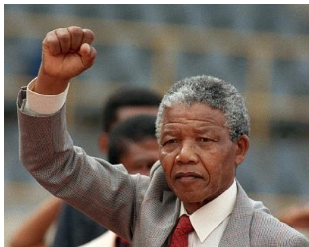
Nelson Mandela (1918-2013)

Loop links langs het station naar het perron. Steek over naar jaarpal 2000.