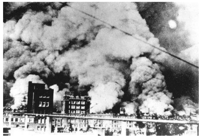
De Duitsers bombarderen Rotterdam

Reken eens uit hoe oud Anne nu geweest zou zijn?