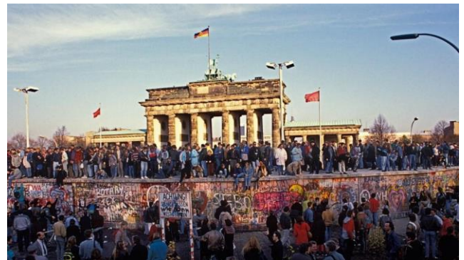
Oost-Berlijners zijn op de muur geklommen om te vieren dat die hen nooit meer zal tegenhouden.

Er was een tijd dat Duitsland uit twee landen bestond: Oost-Duitsland en West-Duitsland. De regering van Oost-Duitsland vond het niet leuk dat veel Oost-Duitsers veel liever in West-Duitsland wilden wonen. Om ze tegen te houden werd in 1961 dwars door Berlijn een enorme muur gebouwd. Bezoek aan familie of winkelen in West-Berlijn was voortaan niet meer mogelijk. Heel veel mensen haatten de Berlijnse Muur en dachten dat die er altijd zou blijven staan. Tot 1989....!