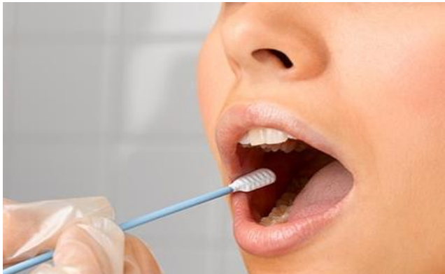
Voor het maken van een DNA-test wordt eerst met een wattenstaafje een beetje slijm uit de mond gehaald .

Door die ontdekking kan de politie tegenwoordig misdadigers op het spoor komen. Ze vergelijkt dan het DNA in haren en huidschilfers die op de plek van het misdrijf gevonden zijn met het DNA van mensen die verdacht zijn. Best wel handig!