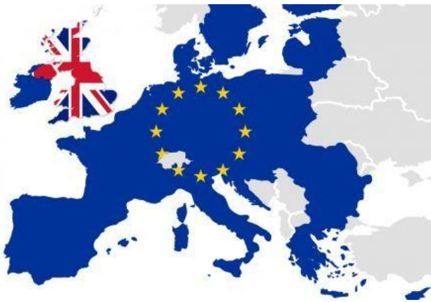
De landen van de Europese Unie