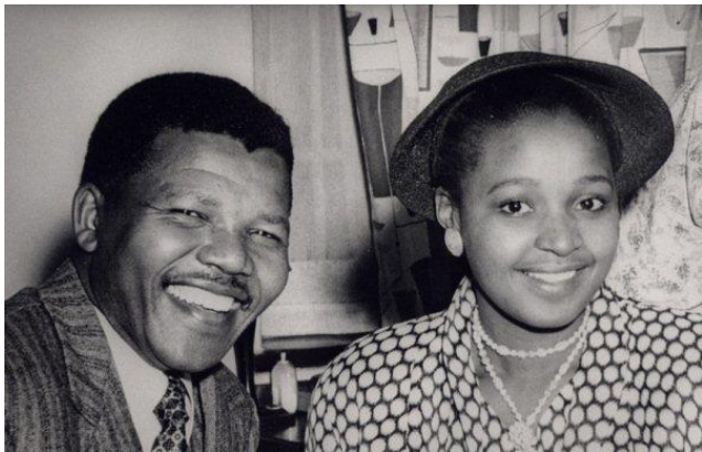
Een oude foto van Nelson Mandela en zijn vrouw Winnie.

Honderd jaar geleden pikten een paar zwarte Afrikaners dat niet langer. Ze stichtten een verzetsgroep die ze het ANC noemden.