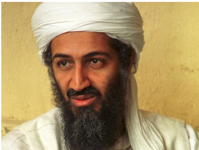
Bin Laden (1957-2011)

Achter de aanslagen zit deze man. Hij heet Bin Laden, een terrorist die zich verbergt in de bergen van Afghanistan. Hoe neemt de Amerikaanse regering wraak?