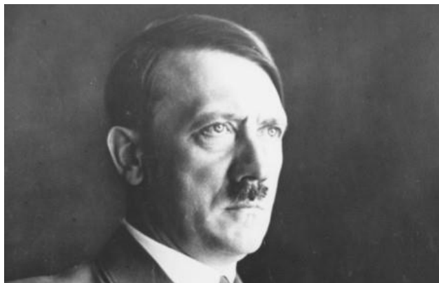
Adolf Hitler (1889-1945)