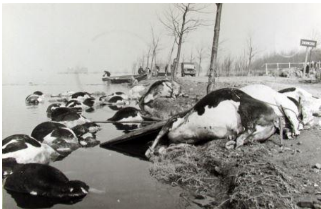
Verdronken koeien in de buurt van Zierikzee