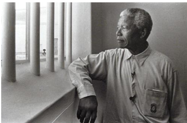
Nelson Mandela in de gevangenis. Zijn leven lijkt uitzichtloos.

En dan is het 1990. Mandela zit al 26 jaar gevangen. In dat jaar is de eerste draagbare spelcomputer te koop. De Italianen zijn bang dat de toren van Pisa zal omvallen. Maar veel belangrijker is wat miljoenen mensen op 11 februari op de televisie zien gebeuren. Lees zelf maar op 1990-W.