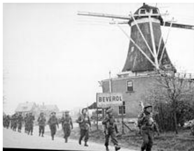
Canadese soldaten bevrijden Holten en Rijssen