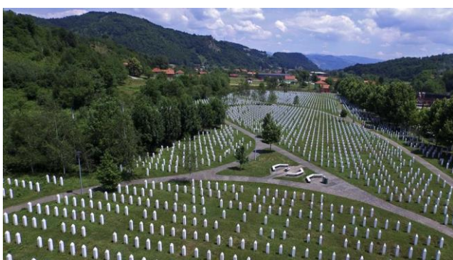
Begraafplaats in Srebrenica

Zuid-Afrika is een land waarin blanken eeuwenlang de baas speelden over hun zwarte landgenoten. Die werden al die tijd gediscrimineerd en als slaven behandeld. Dat heet apartheid.