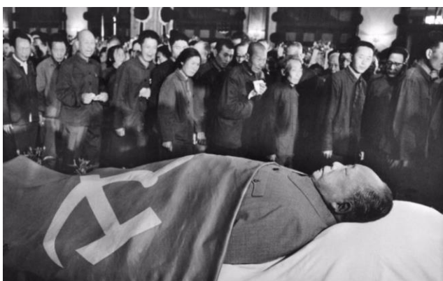
Duizenden Chinezen brengen hun leider de laatste eer.