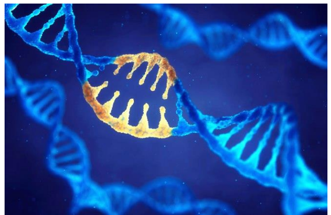
Zo ziet een DNA-molecuul eruit.

Loop nog niet verder en bekijk wat te lezen is op 1953-E.