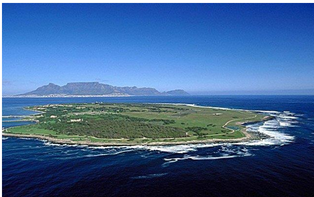
De gevangenis stond op Robbeneiland, een eilandje voor de kust van Kaapstad dat je op de achtergrond ziet liggen.

Enkele jaren later werd ook de zwarte advocaat Nelson Mandela lid van deze groep. Hij werd gearresteerd en moest voor de rest van zijn leven de gevangenis in. Dat was in 1964.