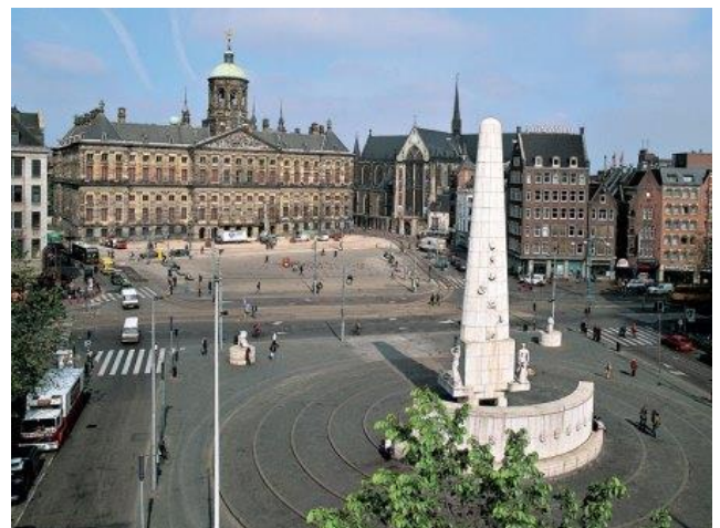
Monument voor de Nederlanders die door de tweede Wereldoorlog om het leven kwamen.

Op 10 mei 1940 vielen Duitse soldaten ons land binnen. Toen ze Rotterdam bombardeerden gaf ons leger zich over. De koningin en de regering vluchtten naar Engeland. De Duitsers hielden ons land vijf jaar bezet. Daar denken we met elkaar nog elk jaar aan terug. Op 4 mei om 8 uur 's avonds.