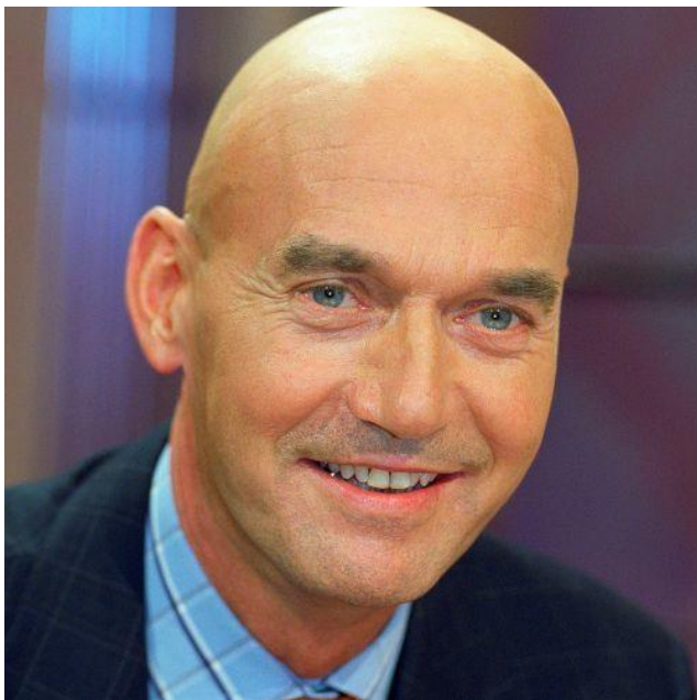
Pim Fortuyn (1948-2002)

Op de rotonde ga je naar rechts, richting station.