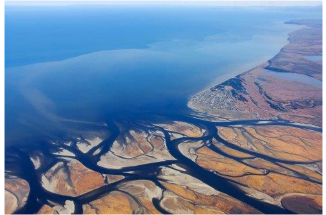
Luchtfoto van de rivierdelta in ons land. Die bestaat uit aftakkingen van de rivieren Rijn, Maas en Schelde. Van bovenaf gezien hebben ze de vorm van de hoofd letter delta in het Griekse alfabet, namelijk de vorm van een driehoek (zie onder).