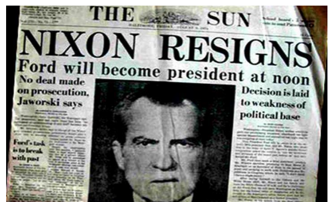
Een krant uit 1974 met het bericht dat president Nixon is afgetreden vanwege het Watergateschandaal.

Dit enorme gebouw staat in de Amerikaanse hoofdstad Washington. Het heet Watergate en is wereldberoemd geworden door een inbraak. Medewerkers van de Republikeinse president Nixon gaven opdracht in te breken in het hoofdkwartier van de Democratische Partij. Er waren namelijk presidentsverkiezingen op komst en dan is het prettig als je weet wat de Democratische presidentskandidaat voor plannen heeft. Ontdek maar hoe dat afloopt.