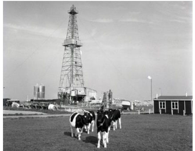
Boortoren in het Groningse plaatsje Slochteren

Als je de QR-code scant krijg je een filmpje over aankomst, verblijf en vertrek van de Amerikaanse astronauten op de maan!