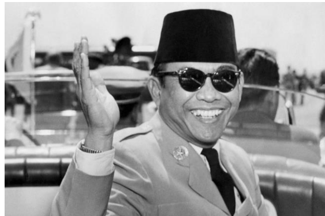
Soekarno, de eerste president van Indonesië.

Ontdek waarom 1949 voor Indonesië en ons land zo'n belangrijk jaar is geweest.